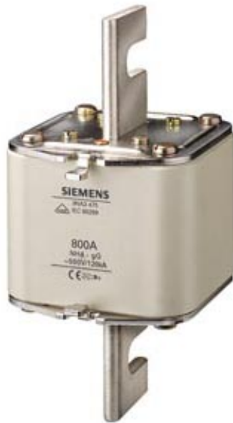
NH-SICHERUNGSEINSATZ GL/GG +SPANNUNGSFUEHREND.GRIFFLASCHEN MIT STIRNKENNMELDER GR.4, 800A, AC 500/DC 440V